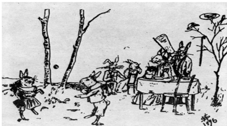
Ábra 1. Nyuszicsalád (W.Stern kísérlete) 15

A következtetés így volt összefoglalható: a cselekménysor meglepetésszerű volta okán többen egyáltalán nem tudtak helyes választ adni, „saját maguk egészítették ki észlelésük hiányosságait....a cselekedetekre vonatkozó adatok lényegesen jobban megközelítették a valóságot, mint a személyek és a ruházat leírása, az időbeli viszonyok megítélése pedig szembetűnően gyenge volt.” 14